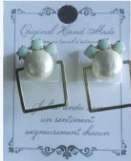
大人華奢 気品のあるデザイン